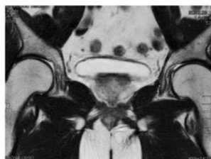
男性(膀胱・前立腺)

骨盤部にある膀胱や、男性は前立腺、女性は膣、子宮・卵巣などが観察できます。多断面の画像を得ることで、骨盤内臓器の疾患を詳しく調べることができます。