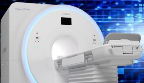
キャノン社製 1.5テスラMRI装置 Vantage Orion